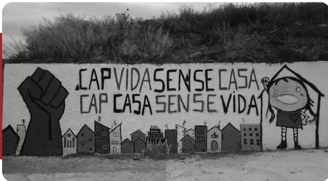
Mural realitzat a l'entrada d'Artés

Mentre l'accés a un habitatge digne pel conjunt de la població esdevé un autèntic calvari, a Artés tenim buit un de cada cinc habitatges . Les paradoxes però, no s'acaben aquí ja que malgrat comptar amb una regidoria d'habitatge les accions que porta a terme brillen per la seva absència. Aquesta desídia de l'equip de govern pren alhora una dimensió inversemblant quan des de l'inici de legislatura s'han aprovat per ple municipal fins a tres mocions relacionades amb el dret a l'habitatge impulsades des dels grups a l'oposició. Així, malgrat ser acords d'obligat compliment, majoritàriament encara esperem la seva realització efectiva, fins al punt que poc després d'aprovar-se per unanimitat la moció Per una política de seguiment, assessorament i suport al dret a l'habitatge front als desnonaments presentada per la CUP es produïa al poble vell un desnonament d'un immoble propietat actualment de la rescatada Bankia.