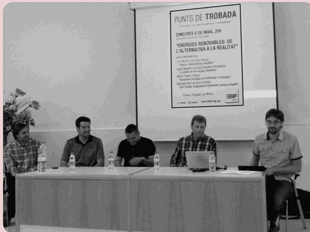
Ponents del Punt de Trobada dedicat a les energies renovables

Durant els mesos d'abril i maig d'enguany la CUP va organitzar, per segon any consecutiu, els Punts de Trobada. Amb la voluntat d'obrir al poble el debat municipal, s'han proposat diversos temes sectorials per tal d'informar, discutir i dibuixar estratègies conjuntes entre tots els participants amb la intenció de crear sinèrgies que millorin el nostre dia a dia al poble.