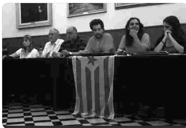
Els regidors de la CUP durant el Ple en què Artés es declarà Territori Català Lliure i sobirà

De les diferents regidories és clar que no totes es gestionen de manera igual, però especialment en educació i cultura no s'avança com cal. En temes d'educació hi ha un desgavell impressionant, amb una regidora que a part de no assistir